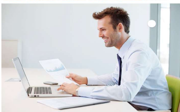
a3factura - Programa de facturación para autónomos