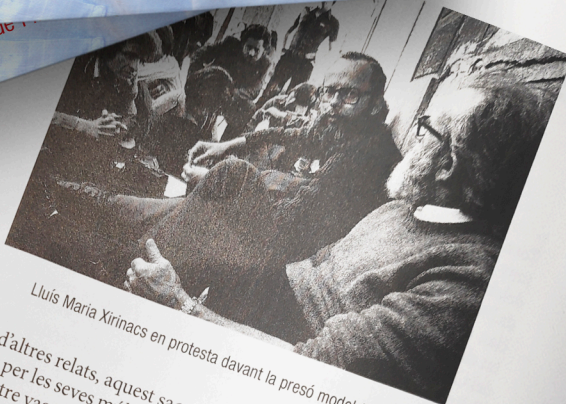
Lluís Maria Xirinacs en protesta davant la presó model (1977)

Entre d'altres relats, aquest sacerdot, escriptor i doctor en filosofia, reconegut per les seves múltiples manifestacions de lluita pacífica com són les quatre vagues de fam que realitza, ens parla de conceptes que, malauradament, ressonen al passat de la nostra història de 300 anys d'ocupació i retornen, com gairebé sempre, als nostres dies. "Des del primer moment vaig copsar les resistències subtils, el silenciament. I també les utilitzacions partidistes interessades, les reconduccions de texts i d'intencions (...). Hauria de constituir un motiu de reflexió el fet que sovint durant la Transició les intencions diferents dels diversos protagonistes de l'oposició van restar-se més que sumar-se". El segon volum de la sèrie de Xirinacs "Una pedregada seca ( juliol 1976-juny 1977)" inclou una crítica (pàgines 85 i 86 de la versió en PDF) de la qual es parla poc, a un dels nostres líders actuals. Una cita que serveix d'exemple a la classificació esquemàtica que segueix i que ensenya alguns dels fets que demostren passos en fals de molts dels dirigents que, des de diversos àmbits, han comandat aquest procés cap a la NO independència. Jordi Sanchez, que seguí la petja de Colom dins La Crida fins a ocupar-ne la cúspide a l'ombra d'aquest, arribaria finalment, com en efecte ha succeït, a dissoldre-la ell mateix contra el parer de molts. Sánchez després no ha dubtat en articles de premsa a dedicar la crí-