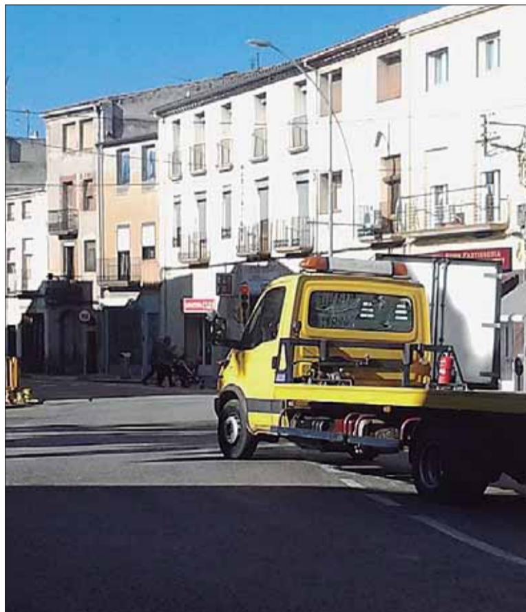
Els camions són habituals al bell mig de Gandesa.

al centre de l'Estat, amb una part de peatge i un tram d'autovia, i les tres variants pendents del tram català de la N-420: Gandesa, Corbera d'Ebre i Riudecols. L'AP-41 Madrid-Toledo i la circumval·lació de la capital manega de l'A-40, de prop de 60 quilòmetres, van cremar etapes amb una facilitat que avui resulta impensable, tot i travessar onze termes municipals i incloure nou enllaços i tres àrees de servei. El 6 d'agost del 2003 va ser aprovat l'estudi, només dos dies després es publicava el plec de clàusules del concurs per a la redacció i execució del projecte, i el febrer del 2004 s'adjudicava a un