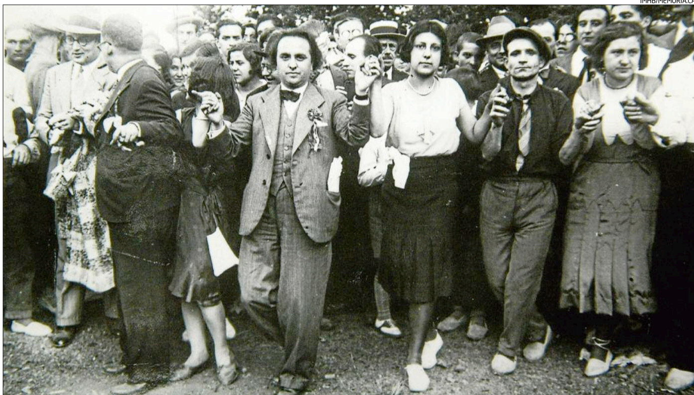
El conseller de Cultura, Ventura Gassol, ballant sardanes a les Marcetes en la commemoració de les Bases de Manresa, el juny del 1931

Finalment, la brillant commemoració d'aquest moment històric del catalanisme, que s'acaba de celebrar, ha fet reviure amb tota l'esplendor i l'exactitud desitjades el record de les cèlebres Bases. Els diaris i els oradors ens han cantat la lletania gloriosa dels noms il·lustres i de les seves ambicions, les quals, en l'any 1892, tenien un aire de follia. Totes les ombres venerables han estat evocades. En l'acte del diumenge, al Kursaal de Manresa, les esmentades ombres no tingueren, per dir-ho així, un moment de tranquil·litat. Els oradors se les passaven de mà en mà, i les ombres, en la seva absència lluminosa, rebien ovacions i ovacions... De