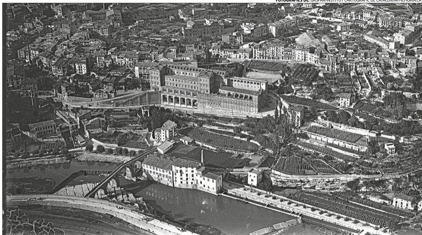
Una vista general de Manresa des de l'actual entrada provinent de Barcelona, amb la Cova i el Pont Vell en primer terme

Jo no diré que aquestes fotografies que ara tinc damunt la taula posseeixin una força emotiva prou important per a empenye'm cap als viaranys relliscosos del surrealisme. Però sí que tenen un no sé què d'anormal i d'inversemblant que m'encomana una febre plena de nebulositats. Aquesta Seu que es retalla amb una precisió geomètrica damunt del fons vague i inconcret del paisatge, no em produeix, ho creuríeu?, cap mena d'inquietud mística. Les coses, vistes des d'enlaire, agafen tot un altre to i tota una altra grandesa que no pas esguardades de terra estant. Aquesta mateixa Seu, que a centenars de vegades ens ha imposat amb la seva dolça majestat, ara se'ns apareix en una actitud ardidament combativa. Més que una pregària, sembla un repte. Efectes d'òptica?