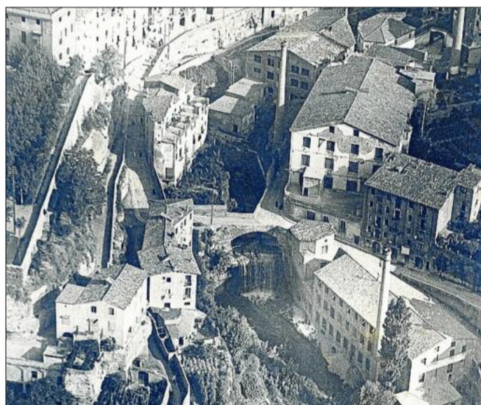
El salt dels Gossos, a tocar de la fàbrica de l'Aranya