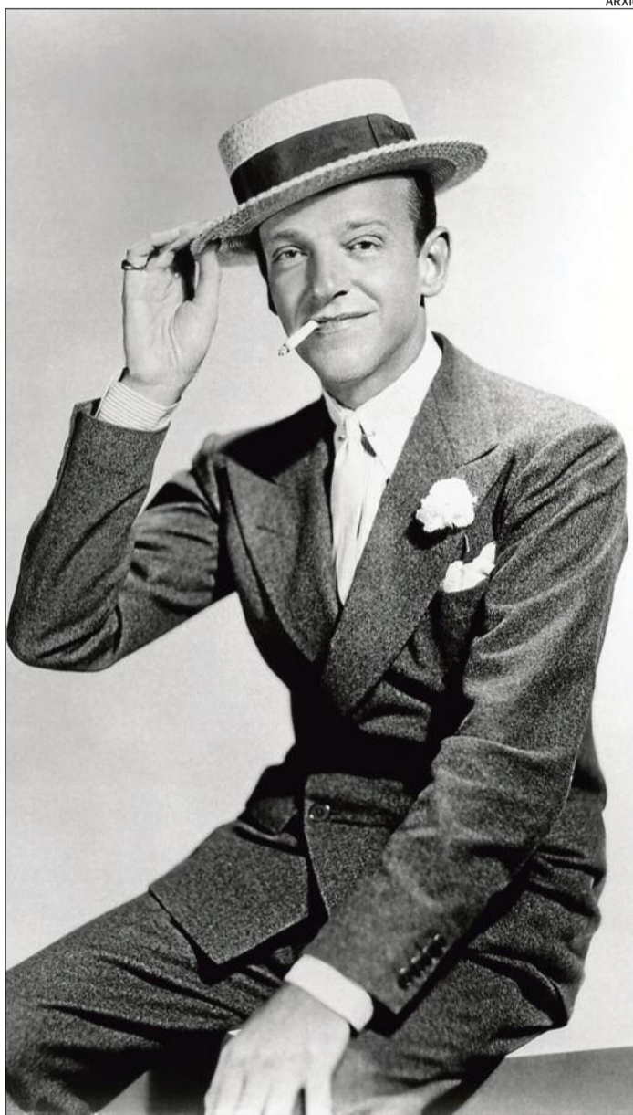
El ballarí Fred Astaire, en una imatge dels anys 1930

I bé: ja hem vist el film de Charlot. El millor elogi que es pot fer de la darrera pel·lícula del gran Chaplin és que no ha defraudat