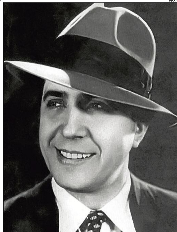
Carlos Gardel, l'heroi argentí enamorat de Barcelona

Gardel fou l'artista màxim del tango en una època en què aquesta cançó triomfava a tot Europa. Algú ha dit que fou ell el que tragué el tango de la taverna i el que el presentà i el féu admetre en societat. Jo havia estat massa amic de Gardel perquè ara