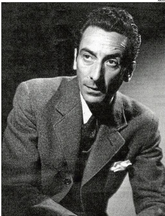
Enrique Santos Discépolo, compositor de tangos per excel·lència

En traguérem la conclusió que el tango barceloní és l'antitango. Potser per això tenia tant d'èxit. Les seves fórmules estovades tocaven de dret el subsòl de la baixa sensibilitat popular. En el cel de la poesia, el tango era l'àngel dolent. Discépolo el vol redimir de la seva immoralitat artística, i així poguérem escoltar com Tània deia les seves cançons amb un nervi i una energia que eliminaven tota llàgrima fàcil.