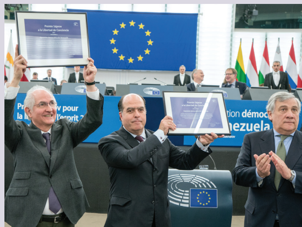
Cerimònia d’entrega del Premi Sàkharov 2017

Onze anys després d’aquestes declaracions i davant la pràctica desaparició de l’Estat de dret i de l’ordre constitucional a Veneçuela, la repressió, els empresonats per raons polítiques i la violència als carrers, han portat al Parlament Europeu a atorgar el Premi Sàkharov a la Llibertat de Consciència 2017 a l’oposició democràtica de Veneçuela.