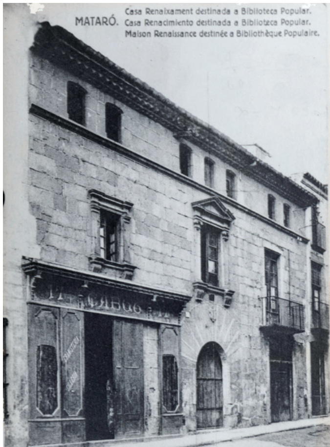
Carreró número 17, aleshores carrer Enric Granados, ca. 1920.