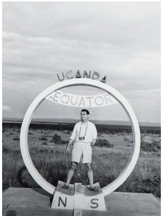
Viatge a Uganda. Finals del 1959.