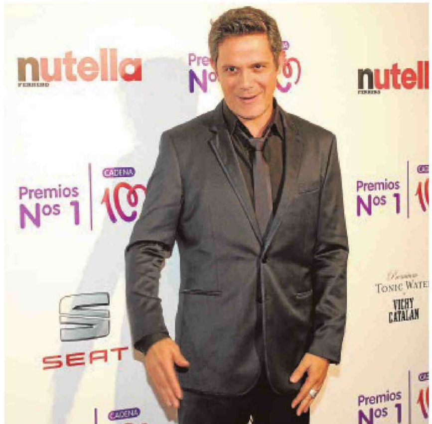
Alejandro Sanz momentos antes de la entrega de premios

Los premios dan reconocimiento al éxito de los artistas musicales del momento y de la pequeña pantalla. Sobre todo, premian todas las cualidades necesarias para destacar en este o en cualquier ámbito profesional: el esfuerzo, la dedicación, el trabajo de base bien hecho, la ilusión. La audiencia de