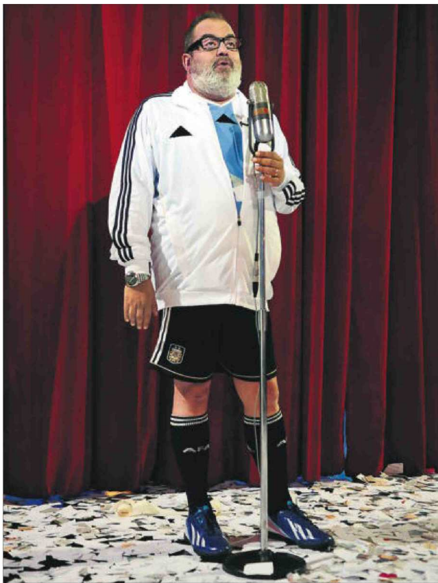
El periodista Jorge Lanata, vestido de jugador de fútbol en su programa del domingo.

El lugar destinado para el público se convirtió en una especie de grada, con alambrada y pancartas. Y dos locutores deportivos iban conectando con el partido y cantando los goles. Finalmente, Newell's le ganó a Boca