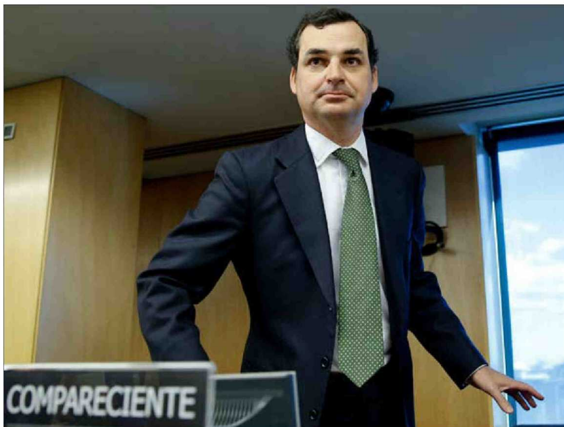
GONZÁLEZ-ECHENIQUE. "El patrocinio cultural es lícito en la Ley de financiación".

Financiación de la corporación para poder patrocinar espacios culturales. Una posibilidad que supone una excepción a la prohibición