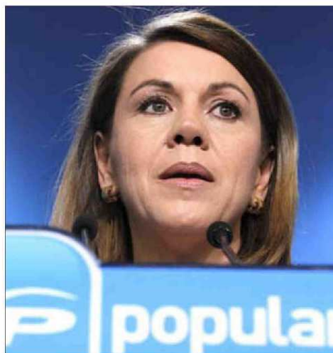
o La Razón se arruina.

Tampoco la barcenología es una materia que quite el sueño a los señores del ABC. Si tienen el buen gusto de sacar a Rajoy en pequeño, un alivio que agradecemos, y el titular “El Ejecutivo extremará el control sobre cargos públicos para evitar blanqueos” (Ah, y Luis Candelas se compromete a reforzar las medidas antirrobo, suponemos). Pero por el tema con el que abre nos enteramos de que “La firmeza del Gobierno desespera a los proetarras”, algo con lo que, si el CIS no miente, disenterán muchos de sus lectores naturales.