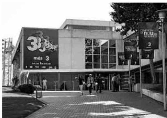
Los directivos de TV3 son de los más afectados por la medida.

El Govern ahorrará cerca de 3,5 millones de euros con el tope salarial de 84.078 euros anuales para sus empleados.