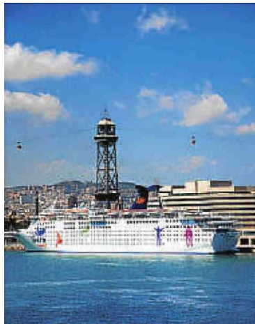
Un creuer al port de Barcelona