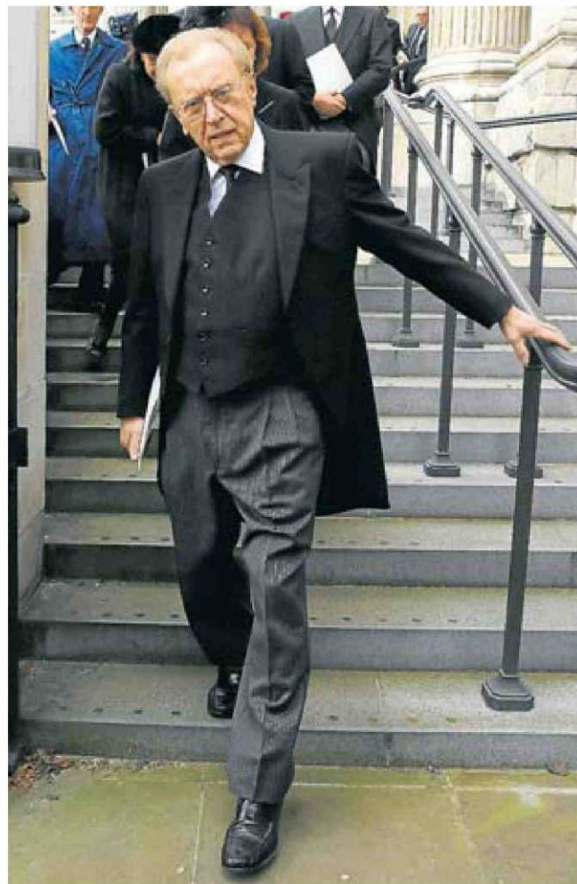
Frost a les escales de la catedral de Saint Paul el 17 d'abril passat en l'enterrament de Margaret Thatcher.

Rècord Va entrevistar set presidents dels EUA i sis primers ministres britànics