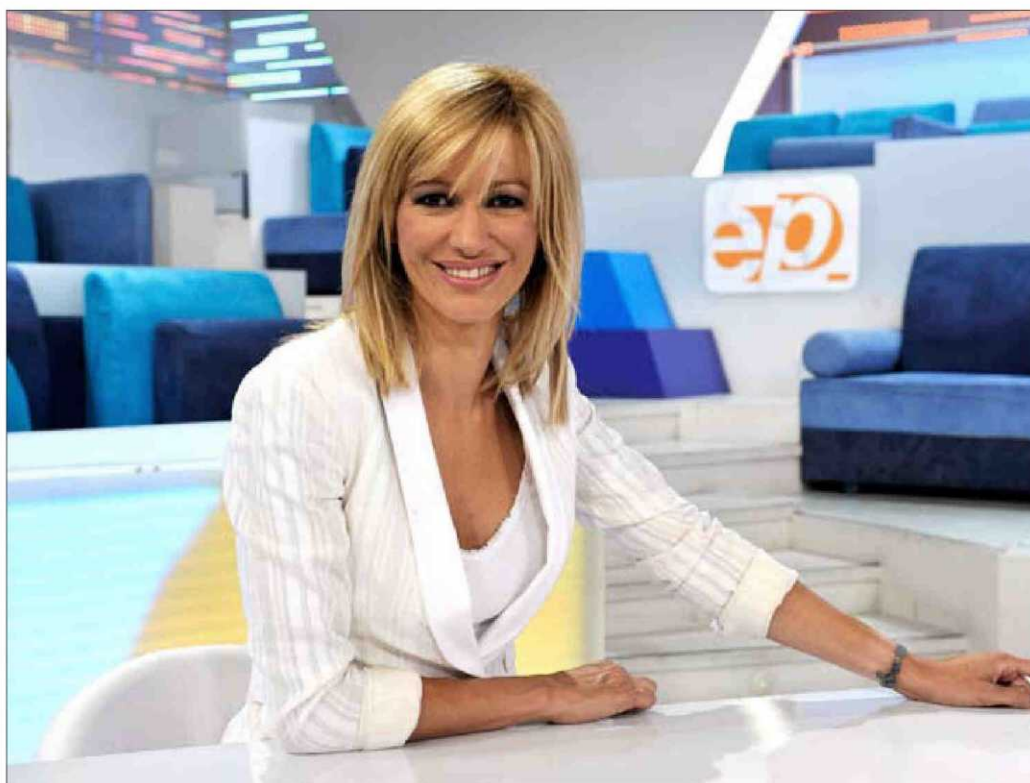
BATALLA. Susanna Griso competirá con Ana Rosa.

hospital la nube de periodistas era inmensa, y la joven atendió primero a Telecinco ante la insistencia de su reportera, que la monopolizó poniéndole un pinganillo.