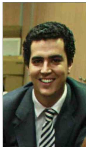
EXPERIENCIA. Ha hecho TV y radio.

En enero de 2010 arranca, junto a Javier Algarra, el magazine "Dando Caña", un espacio de entretenimiento político. A lo largo de los últimos años ha presentado y dirigido Telediarios, Especiales Informativos y diferentes progra-