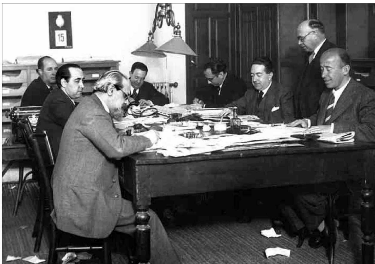
Aspecto de una redacción de periódico en Madrid, con los periodistas en la mesa de trabajo compartida, en 1936.