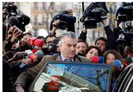
Luis Bárcenas, protagonista informativo en 2013.