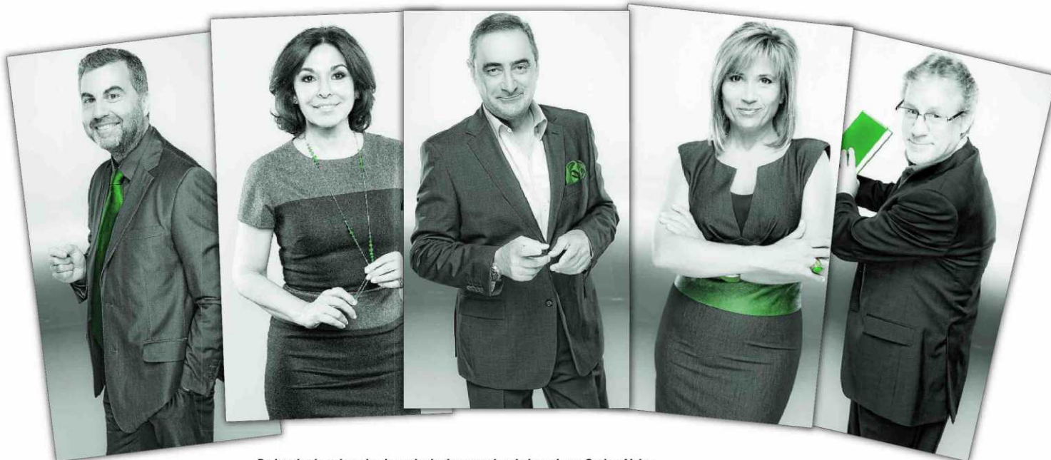
De izquierda a derecha, los principales espadas de la cadena: Carlos Alsina, Isabel Gemio, Carlos Herrera, Julia Otero y Javier Ares