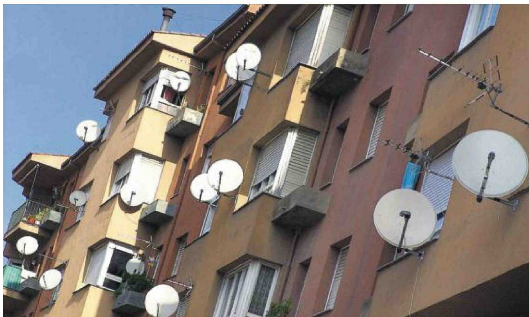
La extensión de la cobertura de las señales de la TDT no se ajustó a las normas de la UE.