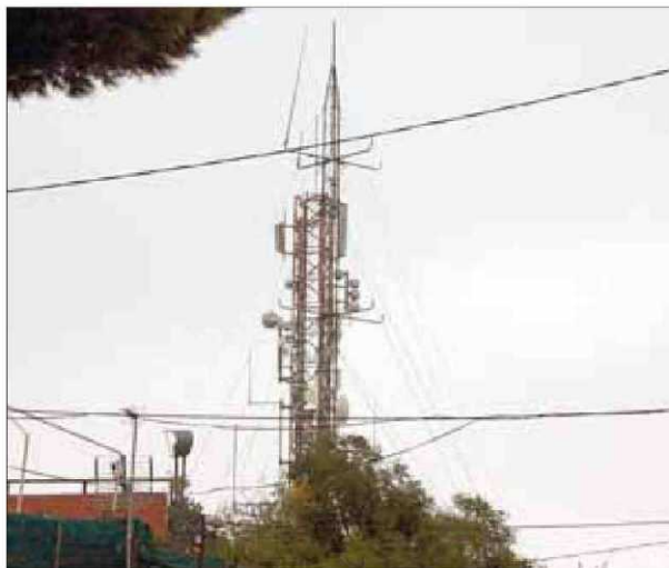
Una de les antenes al cim del turó del Guinardó