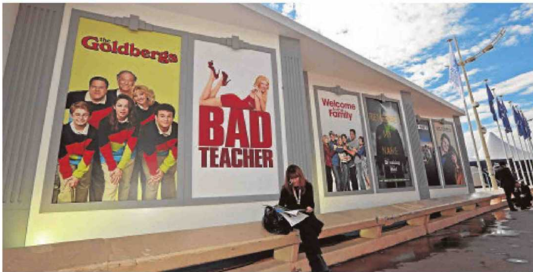
Unos 13.000 participantes y 4.500 compradores acuden este año a la mayor feria televisiva del mundo