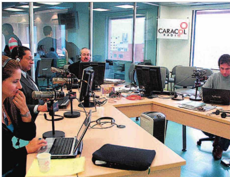
Estudios de Radio Caracol en Bogotá, Colombia.

Entre los integrantes de Aripi figuran empresas destinadas al público de habla hispana como PRISA (compañía editora del diario CincoDías ), la mexicana Televisa, la colombiana Caracol Radio y Caracol TV, Media Capital, Univisión RCN Colombia, Repretel, Albavisión, Continental Argentina, Iberoamericana Radio Chile y RPP Perú.