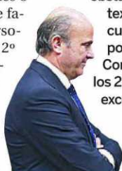
El ministro de Economía y Competitividad, Luis de Guindos

En el anteproyecto de Ley de Servicios y Colegios Profesionales, el Gobierno revela su preocupación porque una cuota de inscripción demasiado elevada obstaculice el ejercicio profesional. Dice el texto: «Son numerosos los colegios con cuotas de colegiación sustancialmente por encima de lo que parece razonable». Concretamente, la cuota no podrá superar los 250 euros anuales, aunque se establecen excepciones si se aprueba en sus asambleas.