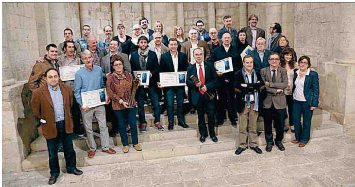
Foto de grup dels premiats ahir al vespre al Museu d'Arqueologia, al monestir de Sant Pere de Galligants