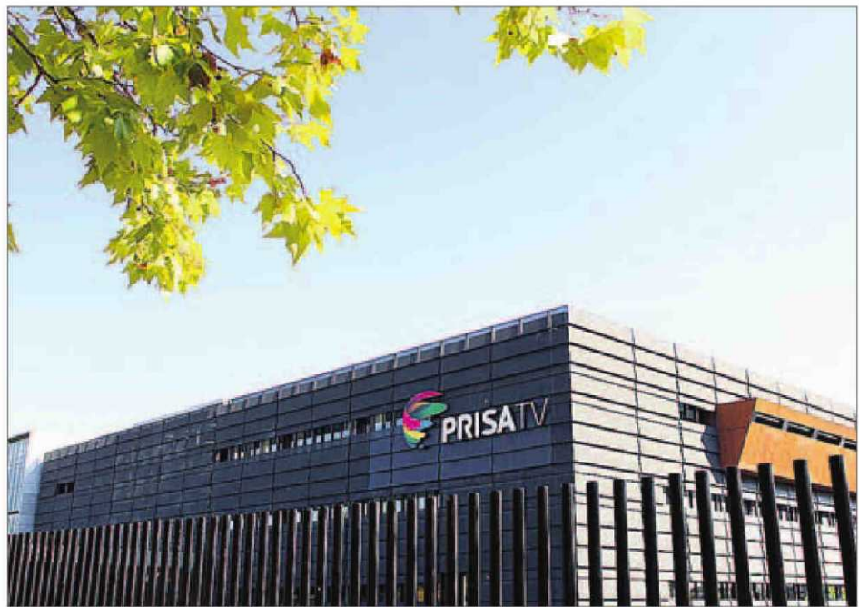
Instalaciones del Grupo PRISA en Tres Cantos, Madrid.

En paralelo, en el área de prensa los ingresos alcanzaron los 200,1 millones, con una caída del 16,4%, cifra que obedece tanto a la debilidad de la publicidad (-2,6%), que ha mostrado una importante mejoría en el tercer tri-