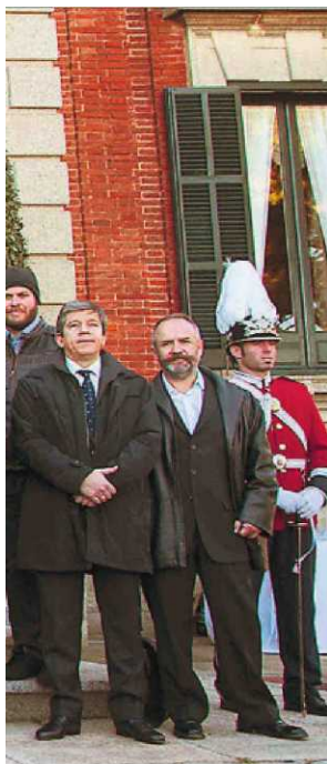
El alcalde de Barcelona, Xavier Trias, posa junto a los premiados y directivos de la cadena SER y el grupo PRISA.