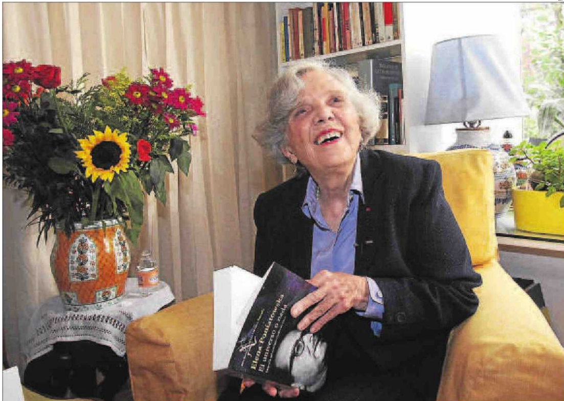
Elena Poniatowska, ahir a casa seua a Ciutat de Mèxic després de rebre la notícia del premi literari.