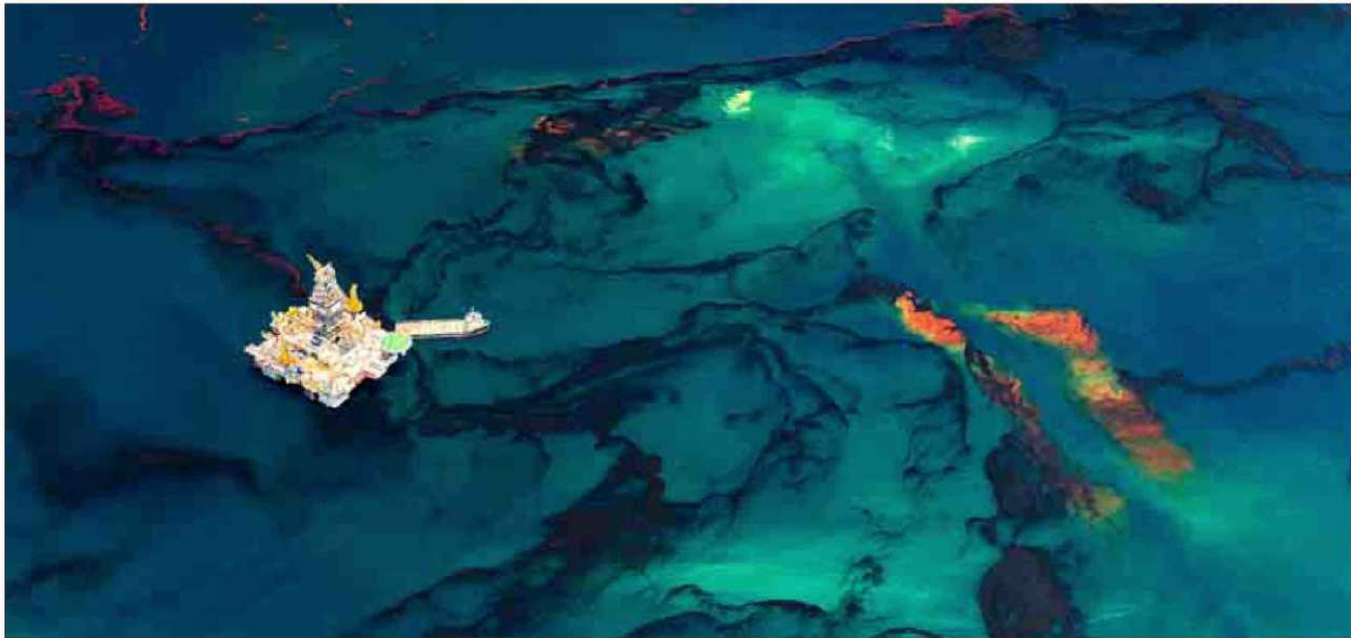
Imagen aérea tomada por Daniel Beltrá durante el vertido de petróleo del Golfo de México ocurrido en 2010, que forma parte de su libro 'Spill' (Vertido). / DANIEL BELTRÁ