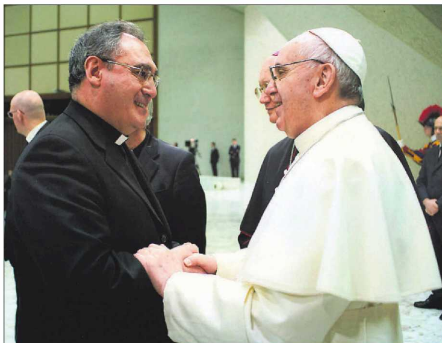
El papa Francisco saluda al sacerdote José María Gil Tamayo durante una audiencia en El Vaticano.

¿La elección es una cuña del Opus Dei en la calle Añastro, en