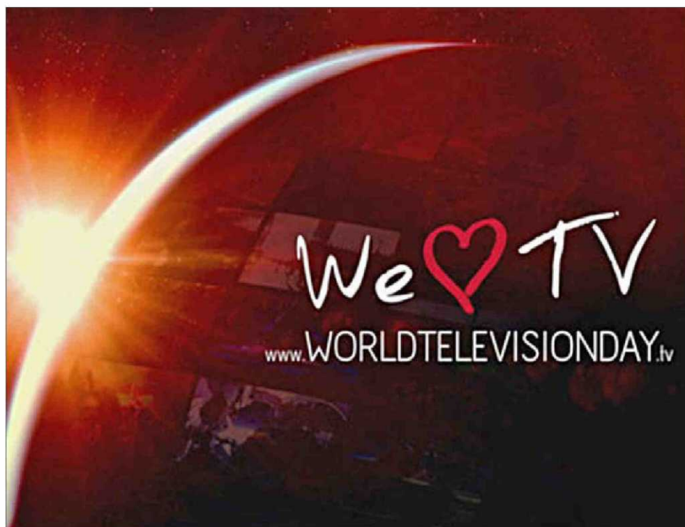
DÍA MUNDIAL DE LA TELEVISIÓN. Por iniciativa europea se ha elaborado el clip ‘World Television Day 2013-We love TV!’.

cen personas de todas las edades y nacionalidades viendo contenidos de televisión en diferentes formatos: desde entretenimiento a noticias, cultura, educación y drama. El objetivo de esta iniciativa, que ha partido de Europa —aunque se