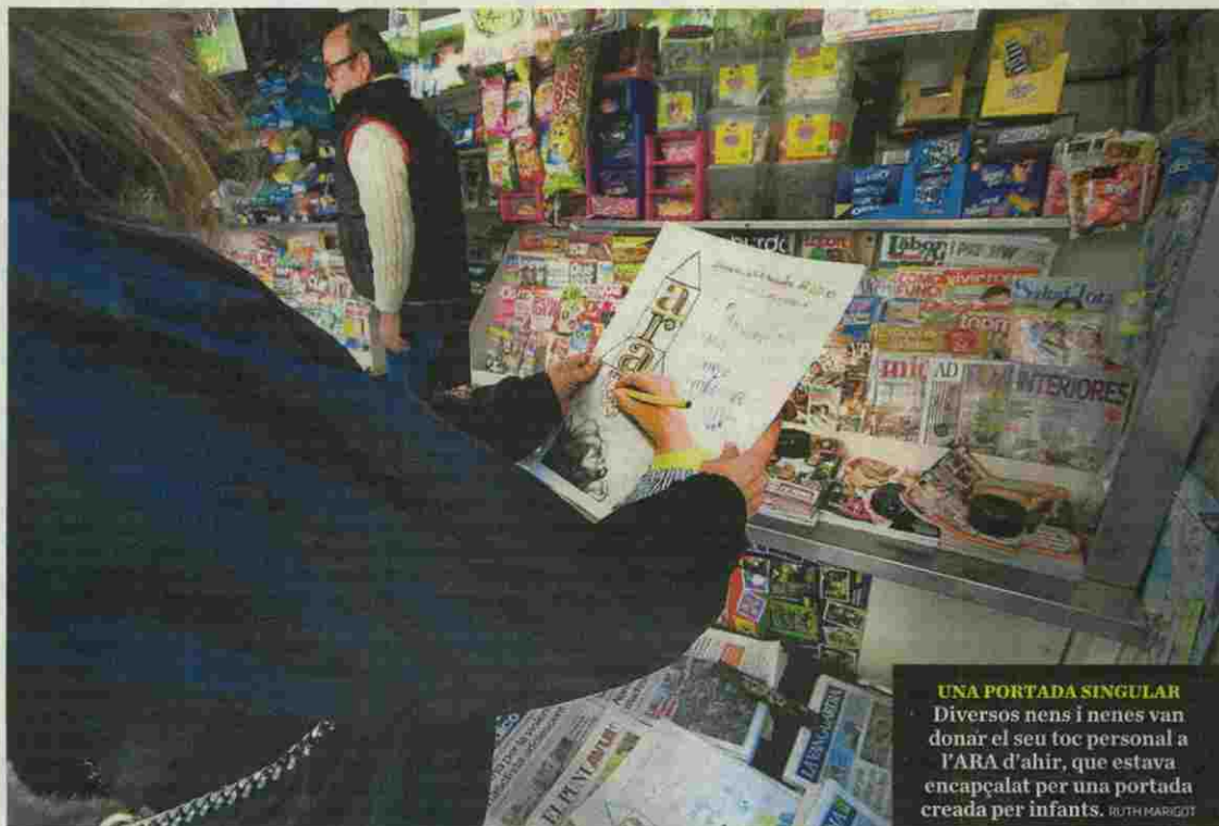
UNA PORTADA SINGULAR Diversos nens i nenes van donar el seu toc personal a l'ARA d'ahir, que estava encapçalat per una portada creada per infants.