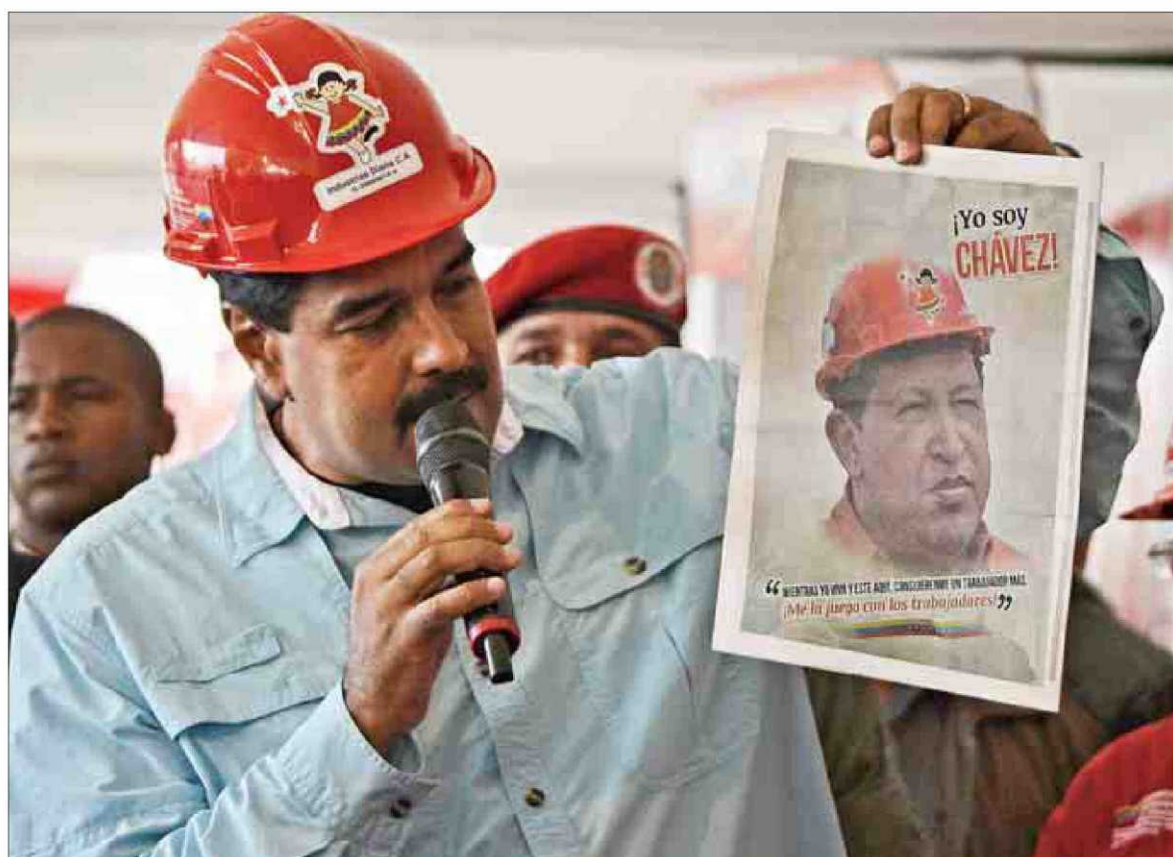
Nicolás Maduro muestra un retrato de Chávez en Caracas durante un programa de televisión.