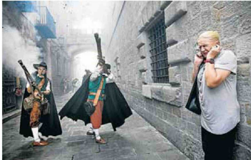
La imatge guanyadora del FotoMercè de premsa gràfica. CRISTINA CALDERER