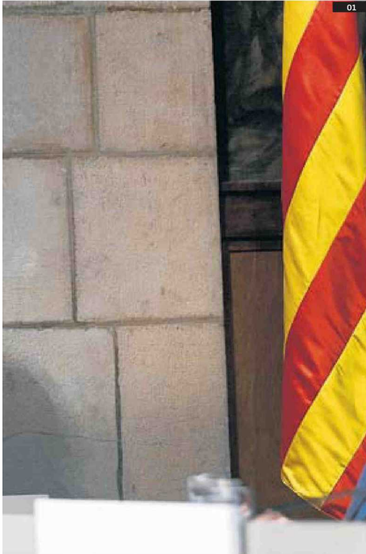
01. Carles Capdevila va recollir el guardó atorgat a l'Ara.cat. 02. Foto de família dels premiats.