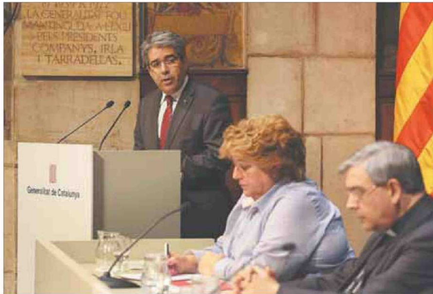
El conseller Oms, la presidenta de l'Associació de Periodistes Europeus i l'actual abat de Montserrat.

Per a l'abat Soler, quan Escarré, a més de la referència als drets humans universals, advocà per la llengua i la cultura catalana, «es va situar contra el corrent a l'època de titllar de se-