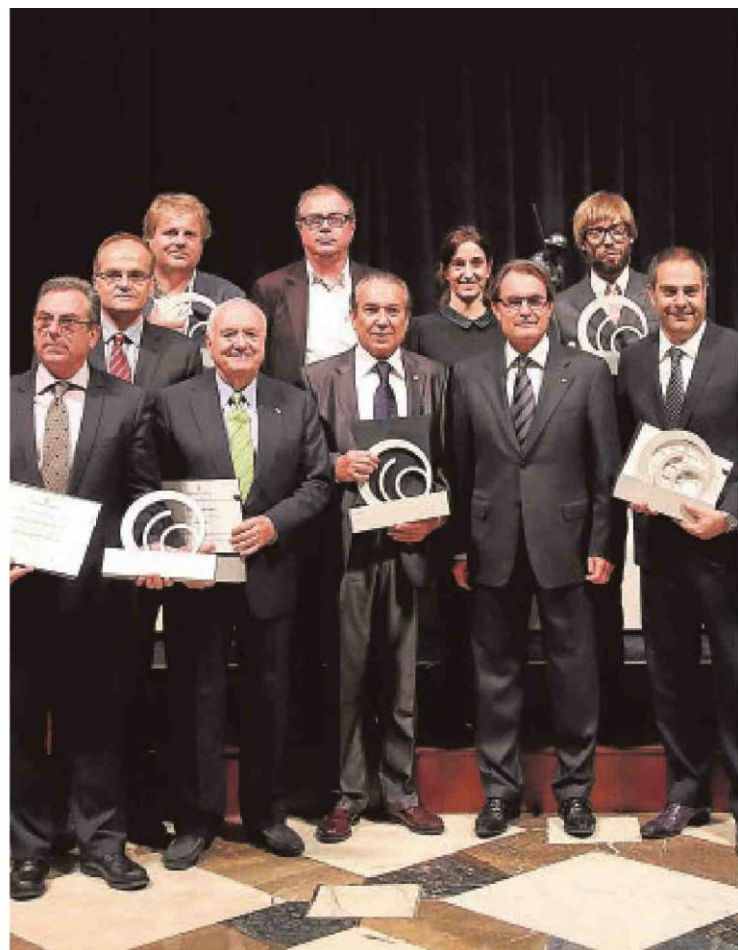
El presidente catalán con algunos de los premiados

El presidente del Gobierno, Mariano Rajoy, mostró su confianza en el «seny» catalán ante el debate sobre el futuro de Cataluña y ha asegurado que él no provocará tensiones, pero «de ninguna manera se va a romper la soberanía nacional».