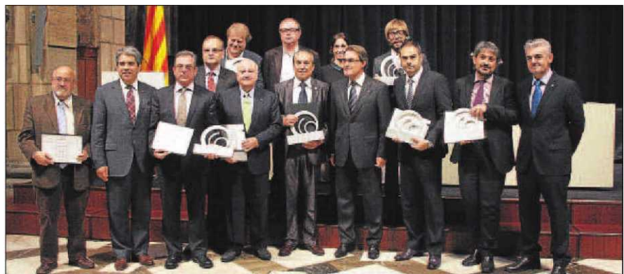
Foto de família dels guardonats amb els Premis Nacionals de comunicació.

cació i per haver prestigiat el periodisme de proximitat, com l'Associació Catalana de Premsa Comarcal (ACPC), del qual forma part SEGRE i en el qual ocupa una vicepresidència; l'Associació Catalana de Premsa Gratuïta i Mitjans Digitals (ACPG), i l'Associació de Publicacions Periòdiques en Català (APPEC), en la categoria de