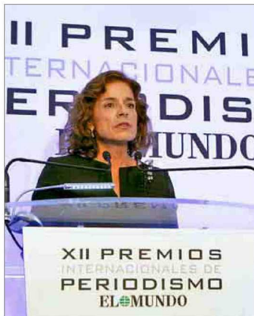
La alcaldesa de Madrid en un momento de su discurso.

No faltan problemas ni demandas a las que tenemos que esforzarnos por responder. Pero Madrid es esa ciudad abierta, de espaldas anchas y vecindad integradora que sabe corresponder a su condición de capital de España con la tolerancia, la libertad, y el respeto y con esa pluralidad que distingue nuestro tejido ciudadano, cultural y social.