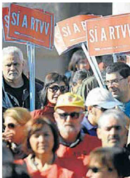
Imatge d'arxiu d'una protesta contra el tancament de RTVV. DANIEL GARCIA-SALA

Aquesta justament va ser una de les peticions que es van plantejar en la reunió. Salut Alcover va assenyalar que havien sol·licitat al vicepresident ajornar la votació parlamentària del dia 27 que donarà llum verda a la llei que legitimarà el tancament de RTVV perquè la proximitat de la data deixa molt poc marge