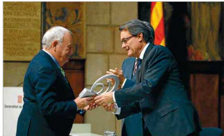
Imatge de grup dels premiats ahir al Palau de la Generalitat ■ ORIOL DURAN

atorgat de manera conjunta a tres entitats: l'Associació Catalana de Premsa Gratuïta i Mitjans Digitals (ACPG), l'Associació Catalana de Premsa Comarcal (ACPC) i l'Associació de Publicacions Periòdiques en Català (AP-