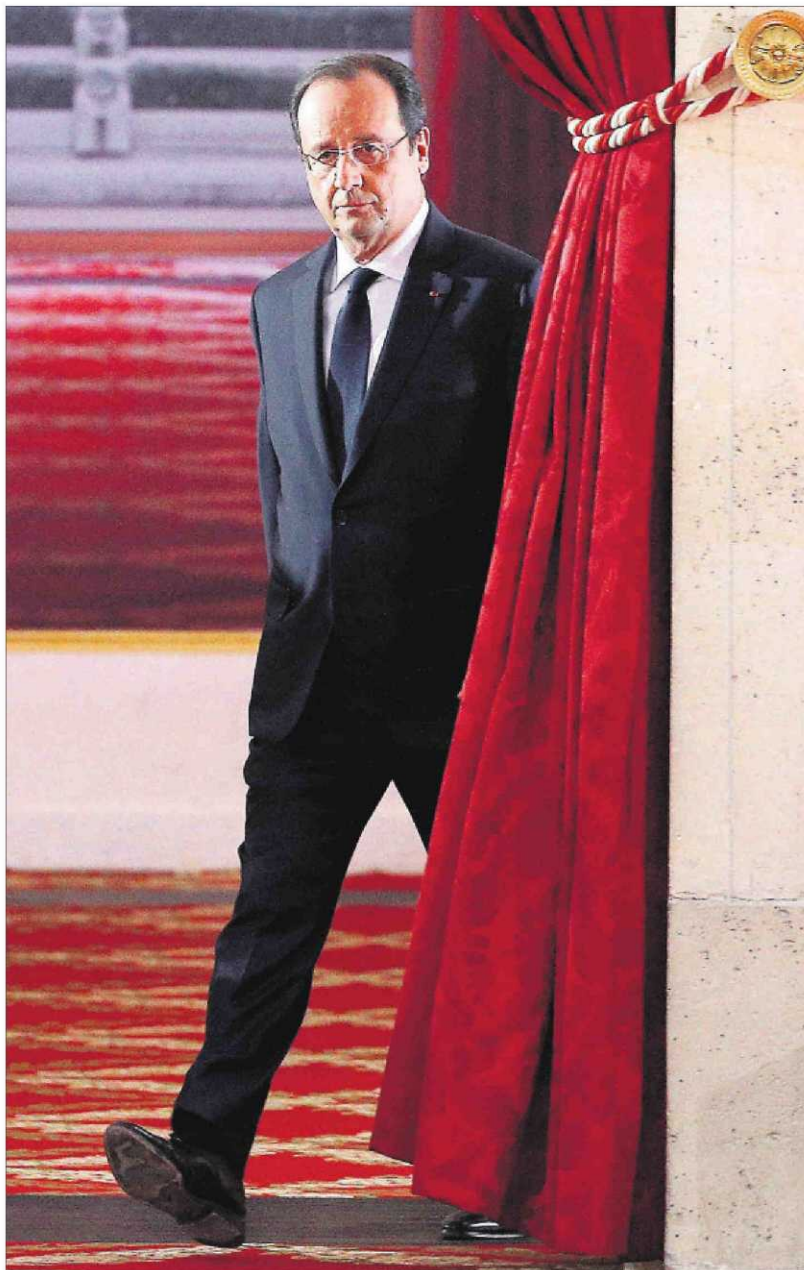
Hollande, a su llegada al salón del Elíseo donde ofreció la rueda de prensa.

Pese a que la comparecencia del presidente duró cerca de tres horas, Hollande se las arregló para no dar una sola explicación