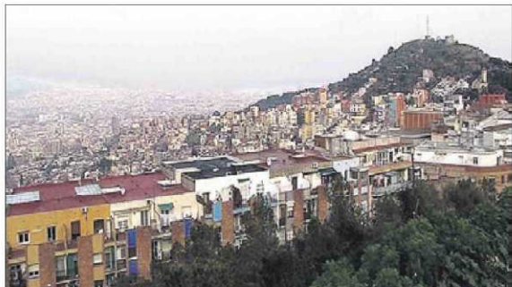
► Fotograma d'"A través del Carmel", que es projectarà el 22 de gener.

EL PROGRAMA // Miradocs arrenca avui amb una història del passat molt lligada al present. Es tracta de Generació Pegaso , que narra els avatars d'un grup de treballadors de la Pegaso -una de les empreses més importants del franquisme- que van arribar al benestar de les seves famílies per lluitar pels seus drets. El film està elaborat amb material inèdit (cintes de Súper 8) i dirigit per Isabel Andrés, filla d'un dels protagonistes, que assistirà a l'acte.