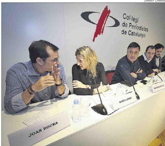
▶▶ La taula de debat d'ahir al Col·legi de Periodistes, a Barcelona.