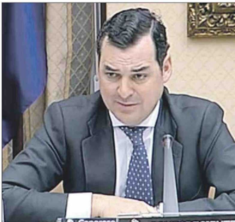
El presidente de RTVE, Leopoldo González Echenique, en el Congreso.

En 2013, la Corporación incurrió en unos gastos de 960 millones, 21 millones más de lo permitido inicialmente. Echenique aseguró que eso se debe al aumento del IVA del 18 al 21 por ciento, que ha incrementado esa partida en 13,5 millones; a la pérdida contable de 26,1 millones por el deterioro del valor de los activos y el incremento del presupuesto destinado a la adquisición de contenidos audiovisuales. Según el presidente de RTVE, esos gastos imprevistos, que no se tenían en cuenta en 2011, cuando el presupuesto de la pública alcanzó los 1.200 millones, son los que hacen