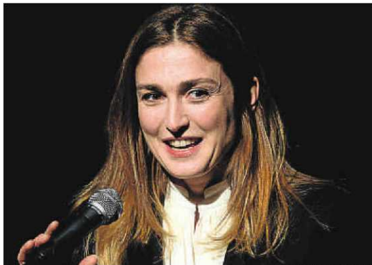
Julie Gayet, el passat 8 de març a Nova York