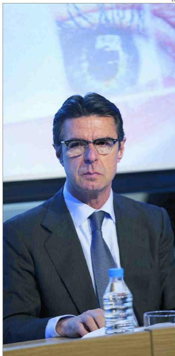
El ministro de Industria, José Manuel Soria, durante una de sus últimas comparencias

PLURALISMO «Con esta decisión se reduce drásticamente la oferta audiovisual y el pluralismo televisivo»