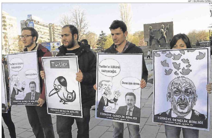
► Joves activistes sostenen cartells contra el tancament de Twitter, el dia 21 a Ankara.

Una setmana després del tancament de Twitter, el Govern de Turquia va ordenar a més a més el bloqueig de YouTube. «No deixarem que YouTube o Facebook es mengin la nostra nació (...) Després [de les eleccions locals] del 30 de març, prendrem noves mesures, inclòs el seu tancament», havia promès el primer ministre, l'islamista Recep Tayyip Erdogan, durant la campanya