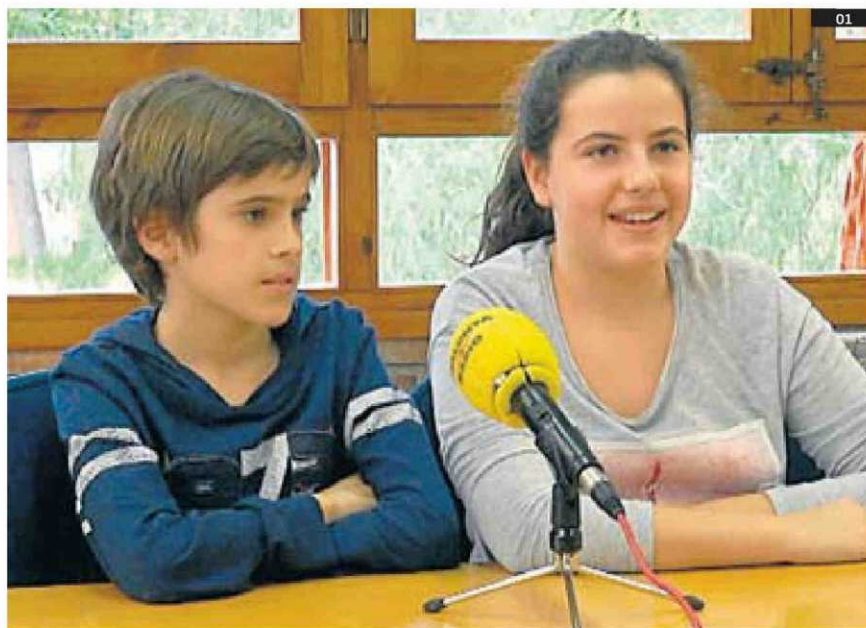
01. El programa farà participar els nens. 02. El petit príncep serà el leitmotiv que relligarà els continguts d'aquest 2014. CATALUNYA RÀDIO