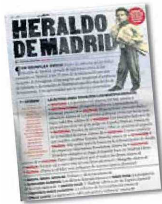
Portada de l'edició especial de l' Heraldo de Madrid .