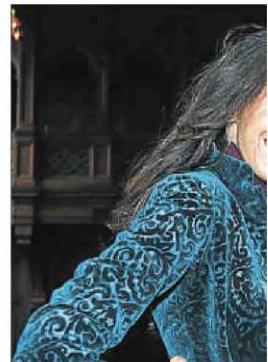
L'Wren Scott i Mick Jagger, el

L'actriu al·legava que la difusió de les imatges va suposar una "violació de la vida privada". Per la seva part, Closer s'escudava en el dret a la informació, ja que diu que l'article es refereix a la seguretat del president i a un "deure de transparència".●