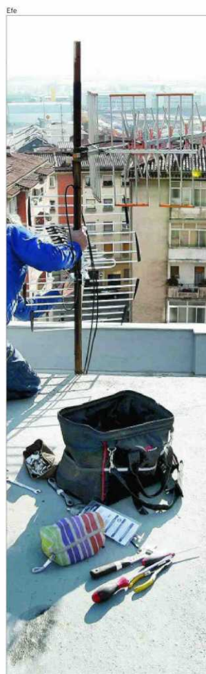
La reantenización llegará hasta abril