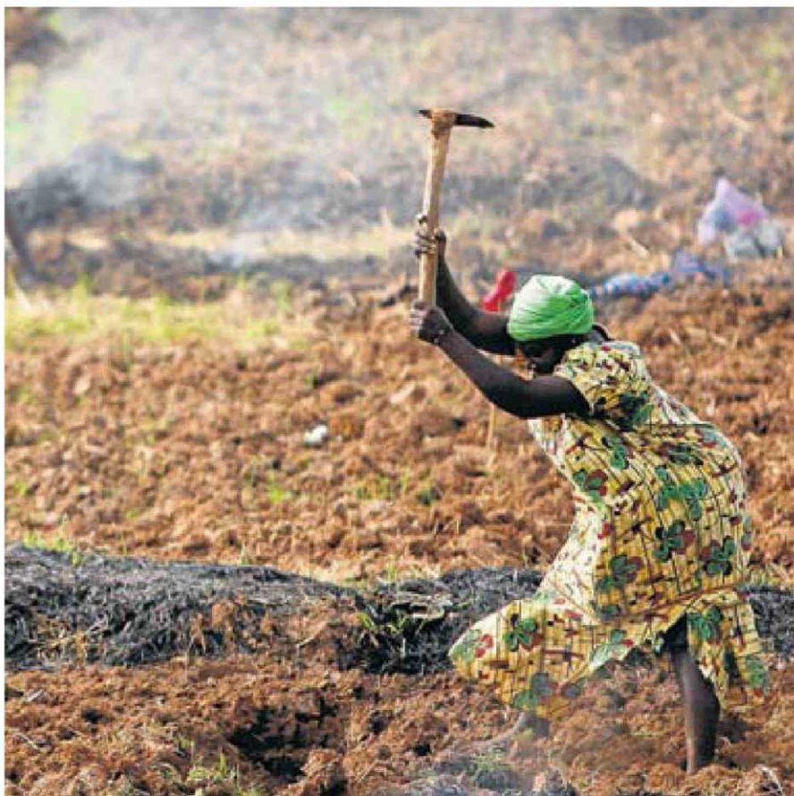
L'anuari inclou un reportatge sobre l'expulsió de pagesos de Guinea Bissau per part de l'empresa Agrogeba.