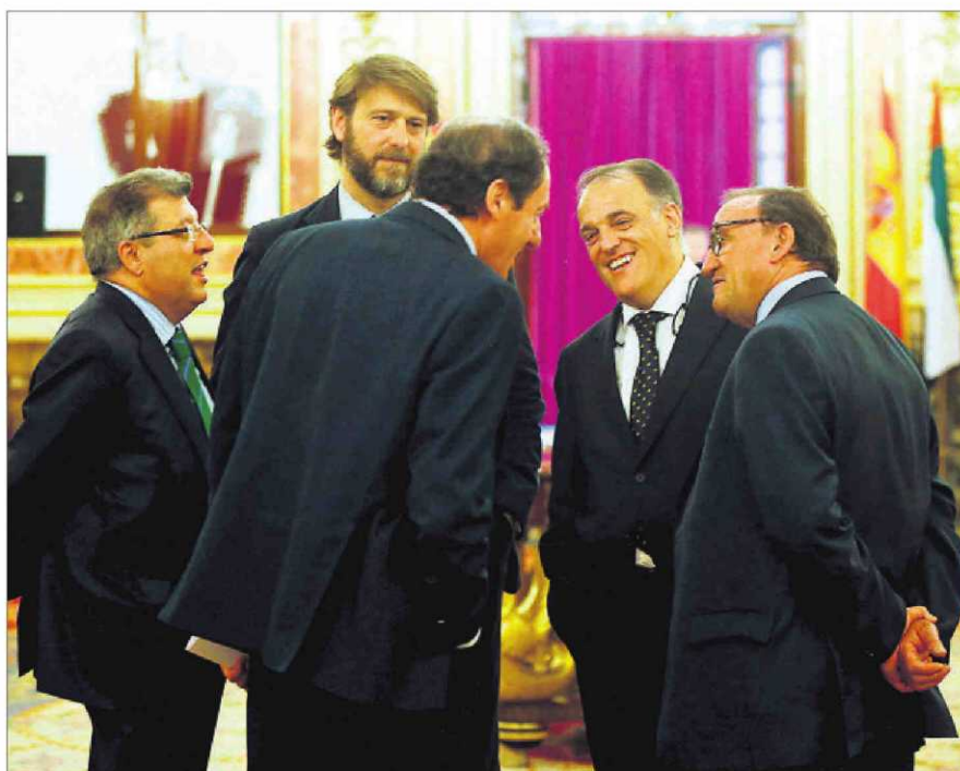
El presidente de la Liga de Fútbol, Javier Tebas (segundo por la derecha), ayer en el Congreso.

Además, el juez también señaló en su escrito indicios suficientes para conceder las medidas cautelares: "La simple lectura de los objetivos de la huelga permite adelantar un juicio provisional favorable a que algunos de sus objetivos podrían tener por finalidad la modificación del convenio co-