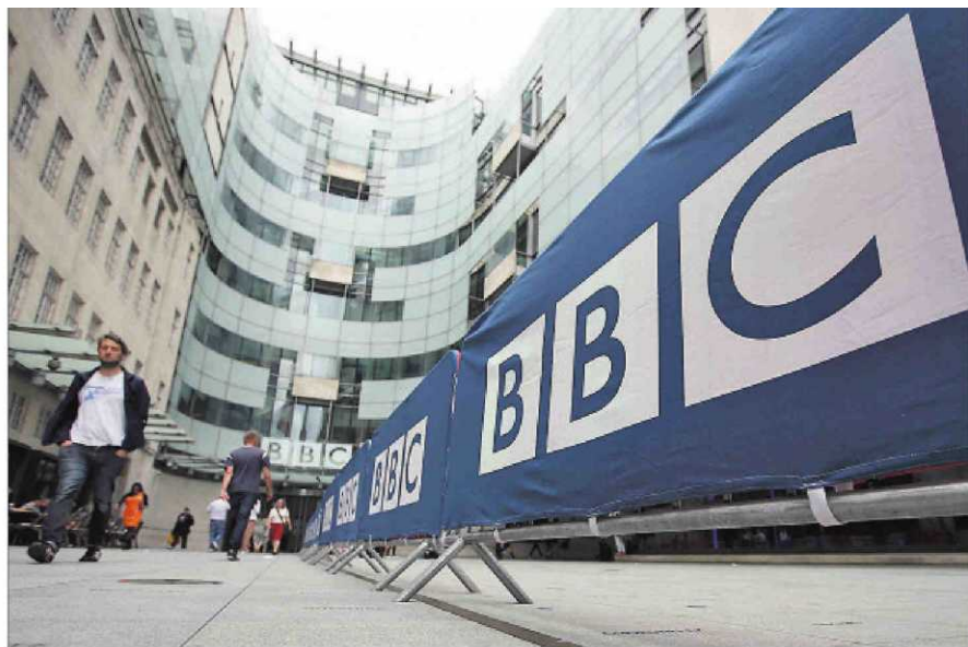
La sede central de la BBC, ayer en Londres.

Financiación. La BBC se financia desde hace 70 años, por un canon (208 euros anuales) que