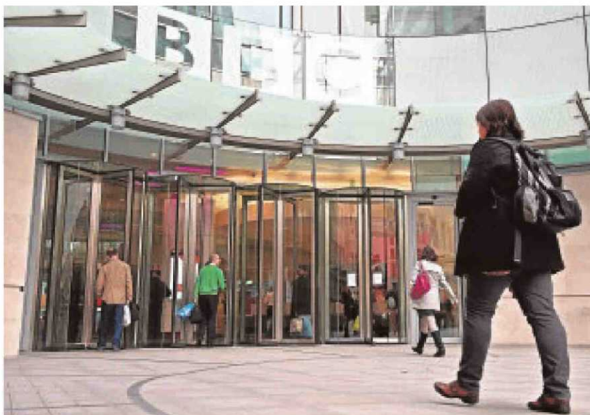
La cadena británica, nuevo punto de disputa en el Parlamento

Tanto la cadena como la oposición laborista rechazaron el borrador de reforma gubernamental. La BBC cree