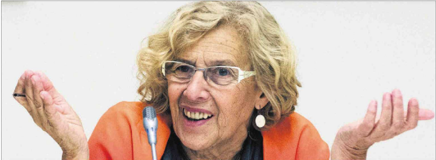
La alcaldesa de Madrid, Manuela Carmena, ayer durante la reunión semanal de su equipo de gobierno.