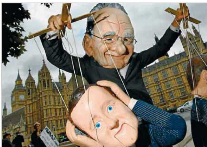
Un manifestant amb una màscara de Murdoch controla el titella de Cameron