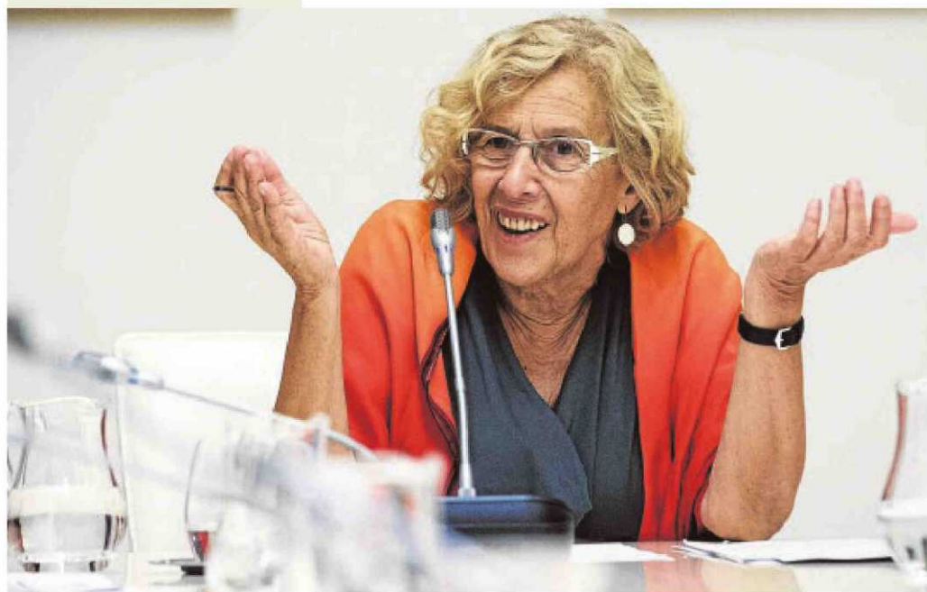
La alcaldesa de Madrid, Manuela Carmena

Revisión en primavera Carmena dice que no revisará «Versión Original» hasta primavera