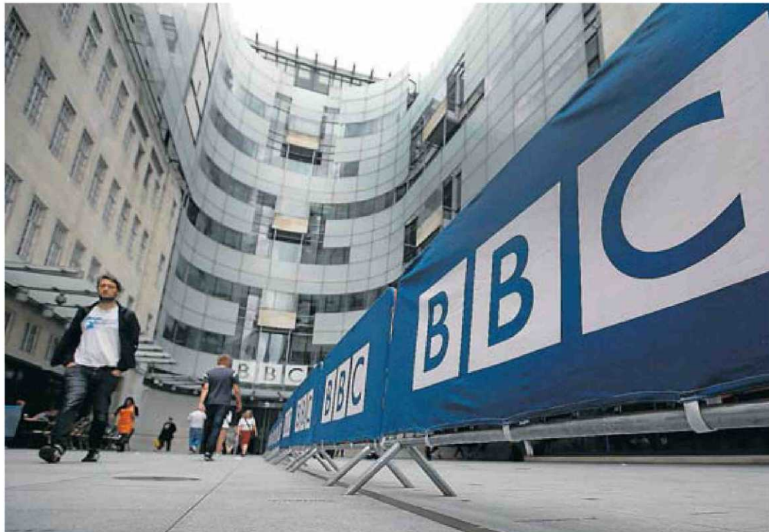
El ministeri de Cultura britànic va presentar ahir un informe per empètir la BBC.

L'informe també fa referència als continguts i critica l'aposta dels últims anys per programes de màxima audiència que competeixen amb les privades, així com els contractes milionaris dels presentadors estrella. Es qüestiona si l'actual BBC és "prou distintiva" amb programes com ara The Voice , un talent show "comprat per 20 milions de lliures i molt semblant a X-Factor , de la cadena privada ITV". El document diu: "La BBC, com a institució pública, no hauria de tenir els mateixos imperatius que companyies comercials ni intentar aconseguir la màxima audiència". A més, el text suggereix que un nombre més alt de programes siguin produïts per companyies independents i obre les portes a la possibilitat de privatitzar una part de la divisió de produccions de la BBC, inclosa la branca comercial de la corporació, BBC Worldwide, que és la