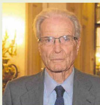
Antonio Garrigues Walker