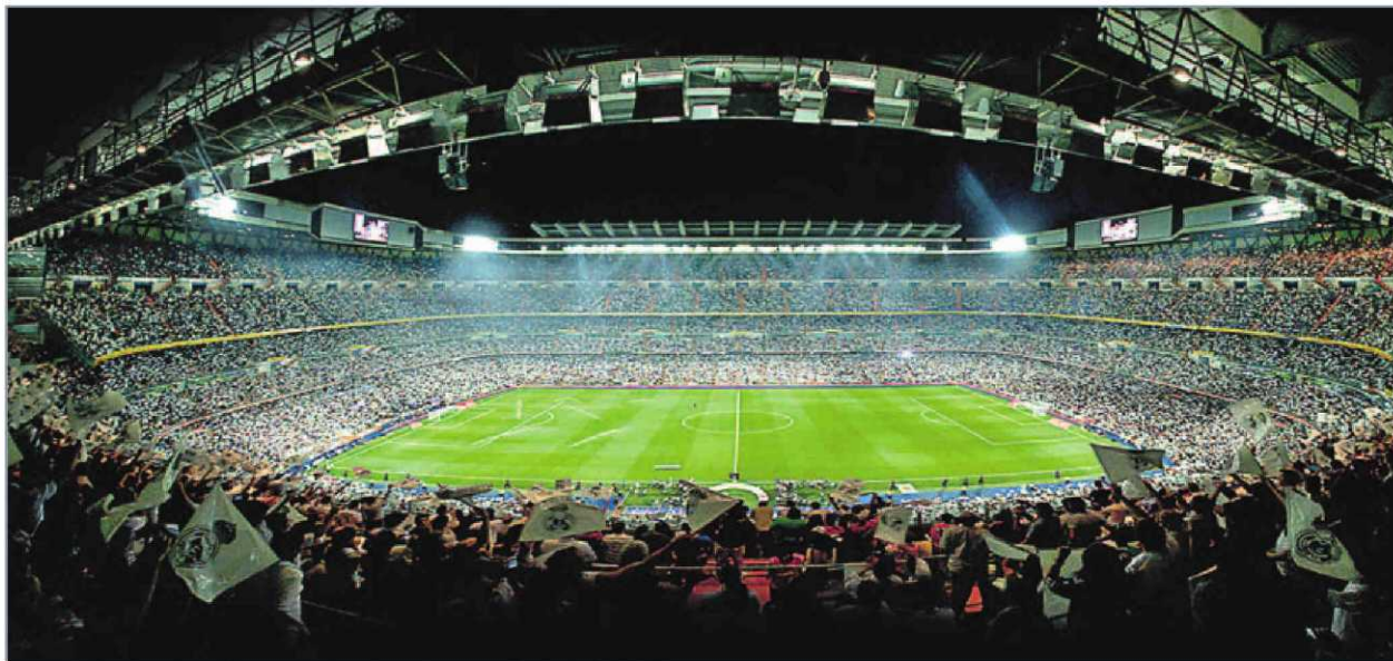
El estadio Santiago Bernabéu, antes del comienzo de un partido del Real Madrid.