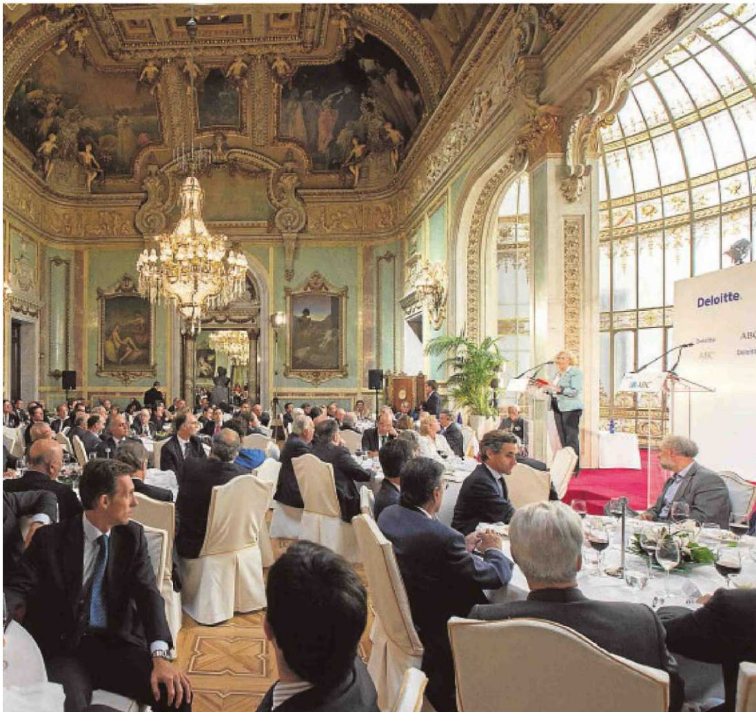
La alcaldesa de Madrid, Manuela Carmena, se dirige a los asistentes del Foro ABC-Deloitte