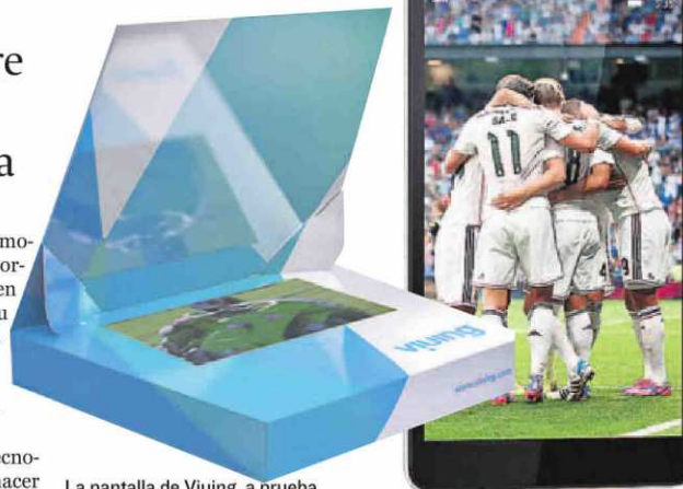
La pantalla de Viuing, a prueba en el Mundial de motociclismo.

Eso pensaron en la startup Viuing, que ha firmado un acuerdo con Dorna, promotora del mundial de motociclismo, para probar su producto, una pantalla portátil desechable. "En grandes eventos como carreras, u otros que se hacen