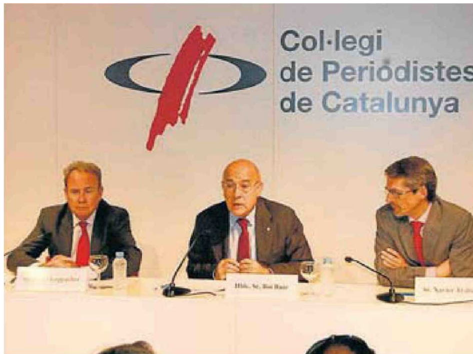
Moment de la presentació del dossier. GENERALITAT DE CATALUNYA