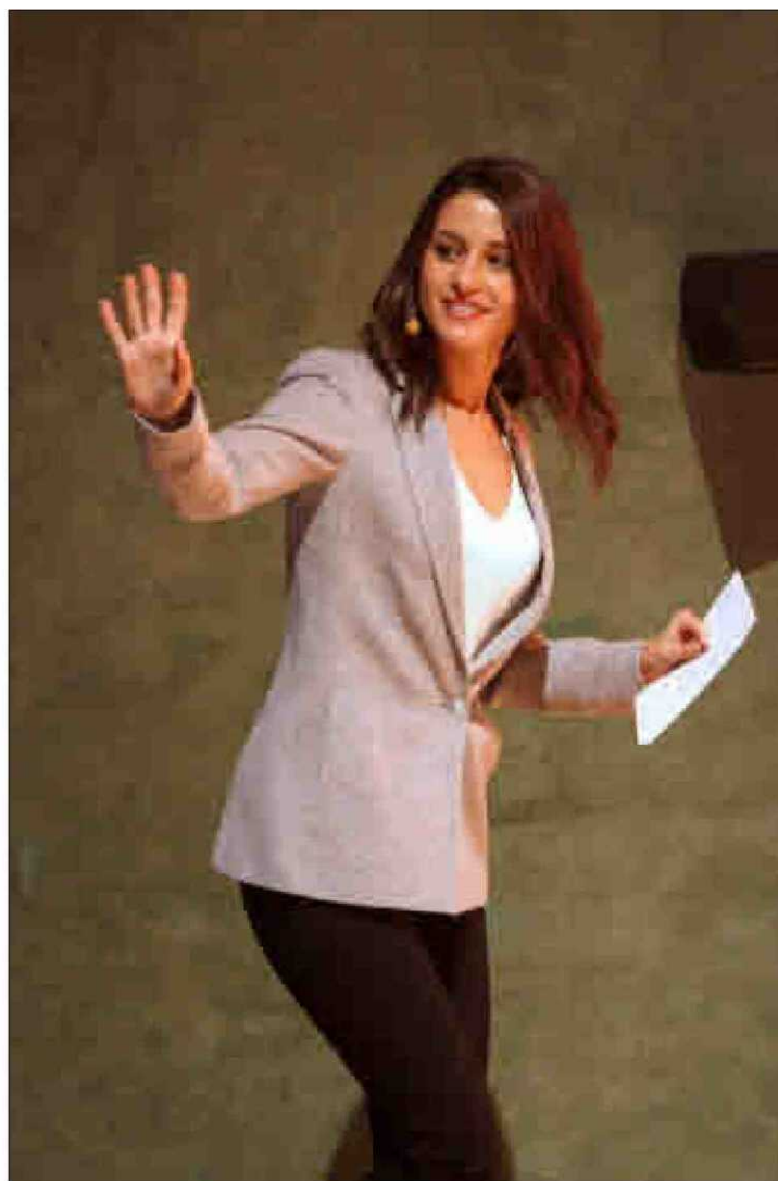
La candidata de Ciutadans a la Generalitat, Inés Arrimadas.

La solicitud del PSC y Ciutadans se une a la que presentó el pasado lunes el cabeza de lista del PP por Barcelona. Xavier García Albiol reclamaba directamente que TV3 no emita la manifestación independentista de la Diada.