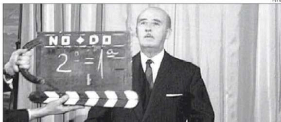
►► Francisco Franco, durant el rodatge d'un noticiari del NO-DO.

En total, són 6.573 documents i 1.719 hores de vídeo el que pot ser visitat per internet. Entre els nous continguts incorporats figuren les seccions Revista imágenes , Imágenes