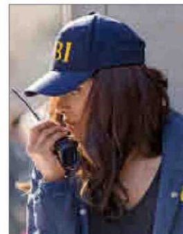
Una de las reclutas de 'Quantico'.

En cuanto a los reconocimientos, al igual que los éxitos de los agentes infiltrados se queda en el anonimato, en el caso de un periodista encubierto, su firma tampoco se lleva la gloria.