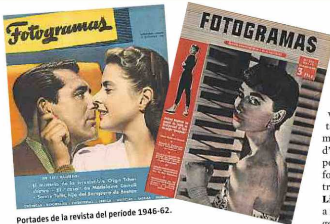
Portades de la revista del període 1946-62.

Una etapa en què, mentre que a les sales de cinema es projectaven els productes que