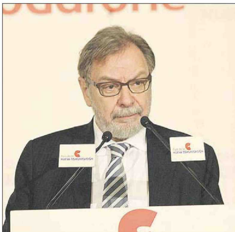
El presidente del Grupo Prisa, Juan Luis Cebrián.

Fuentes oficiales del Grupo Prisa confirman que se está explorando la posible venta de Cinco Días , pero insisten también en que no se trata de un asunto ni prioritario ni urgente, al no ser una empresa que genere problemas de deuda. En Prisa están convencidos, además, de que Cinco Días obtendrá este año ebit-