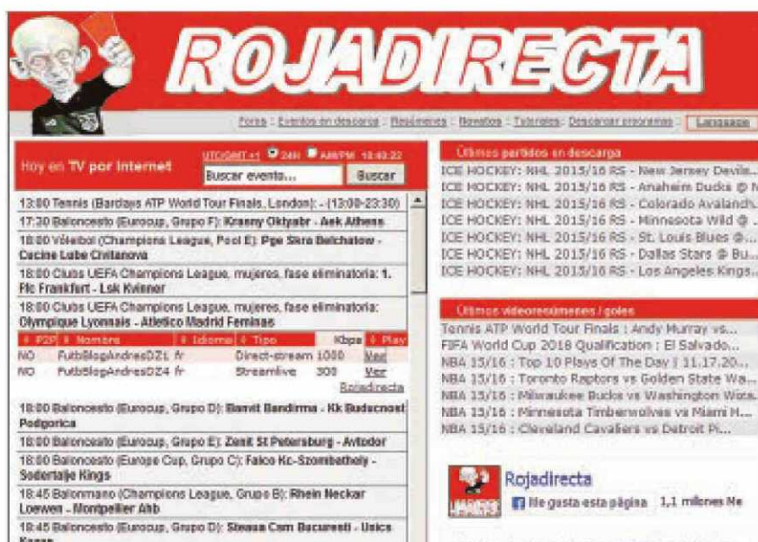
Captura de la web más famosa de descargas gratuitas de partidos

La solicitud fue rechazada de plano por los abogados de Mediapro y Gol Televisión, que consideraron que las medidas cautelares «no se están cumpliendo y cualquiera lo puede comprobar si este fin de semana entra en la web». Además, los letrados indicaron que Rojadirecta «no atiende los requere-