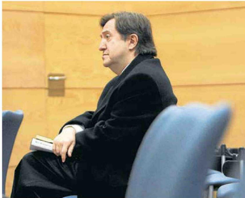
El periodista Federico Jiménez Losantos ha sigut sancionat en diverses ocasions per insultar personatges públics.