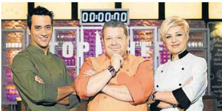
L'equip del programa Top chef , emès per Antena 3.