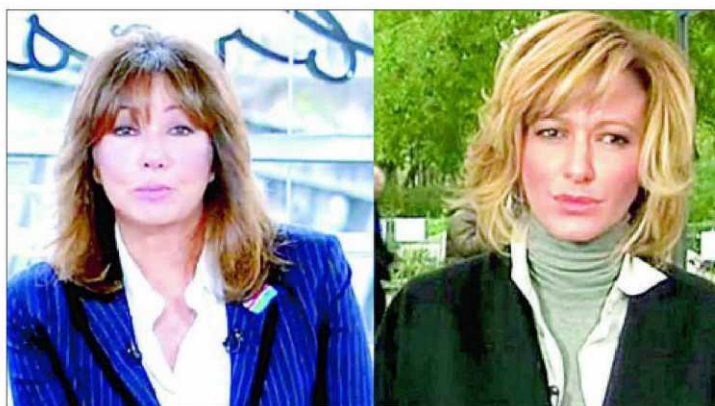
Ana Rosa Quintana y Susanna Griso trasladaron sus directos a París