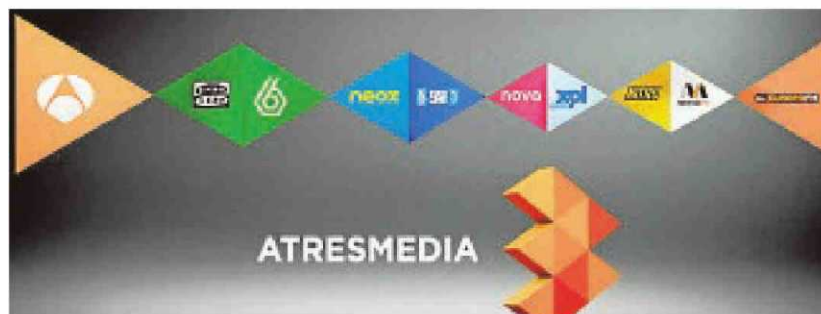
Los logotipos del grupo Atresmedia, entre ellos los de Antena 3 y La Sexta

Esta multa por «infracción grave», una de las más altas de los últimos meses, es de causa similar a la sanción de 15,6 millones que la CNMC impuso a Mediaset hace dos años.