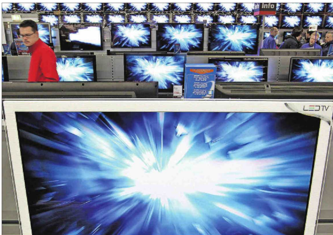
Un cliente pasea entre televisores en una tienda de la cadena Saturn en Volketswil (Suiza).