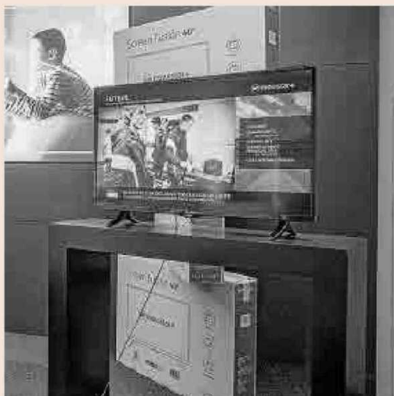
Uno de los nuevos televisores de Telefónica.

Uno de los usos previstos para este proyecto es el de convertirse en el segundo televisor del hogar, aunque para ello hay que contratar, adicionalmente, la función Multi+, es decir la posibilidad de recibir dos señales de TV a la vez, para poder contemplar programación diferenciada en cada