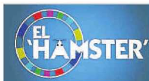
Logo del nou espai de 8tv

Amb les eleccions del 20 de desembre ben a la vora, un cop més Josep Cuní està decidit a convertir-se en el referent informatiu per a milers de catalans. Per a aquestes properes setmanes, el director dels serveis informatius de 8tv ha preparat un ampli desplegament informatiu