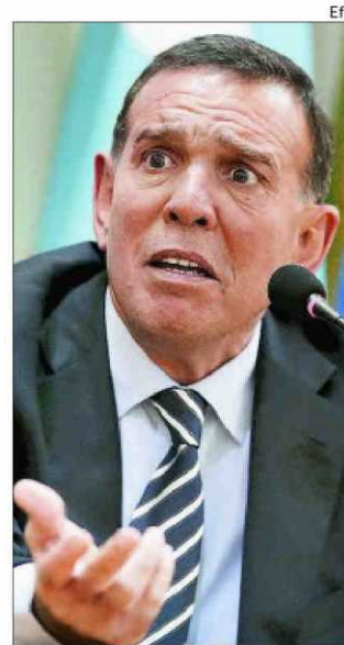
Juan Ángel Napout

La detención de Hawit y Napout viene acompañada de la investigación a 16 miembros o ex miembros de la FIFA por la Justicia estadounidense que, se estima, pueden haber recibido sobornos por valor de 200 millones. La fiscal general estadounidense, Loretta Lynch, en conferencia de prensa aseguró que «directivos y empresarios del fútbol corrompieron los valores del fútbol para enriquecerse». «Hay 16 nuevos acusados, todos ellos dirigentes del fútbol