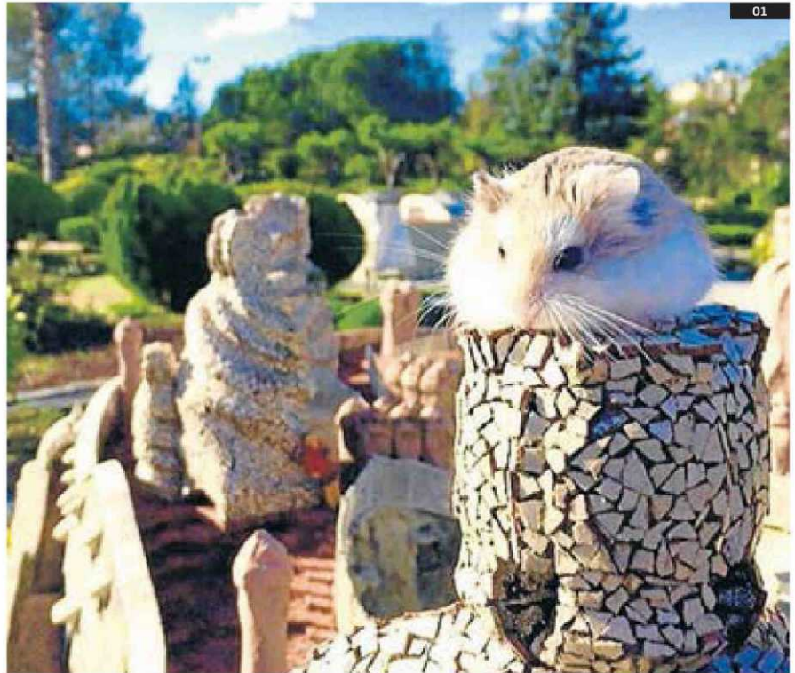
01. El hámster recollirà, amb un punt d'humor, declaracions i moments de tertúlia sobre el procés sobiranista. INSTAGRAM 02. 8TV emet, des d'avui, la sèrie Miénteme . FOX

En un principi, El hámster havia d'ocupar la franja dels divendres a la tarda. Ara bé, davant els bons resultats d'audiència de Trencadís aquesta setmana, després que el programa hagi renovat la imatge i els col·labo-